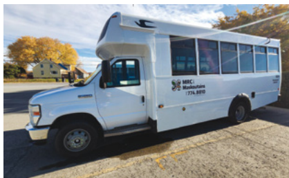
Les Studios François Larivière | @ MRC des Maskoutains

450 774-8810, option 3 mrcmaskoutains.qc.ca