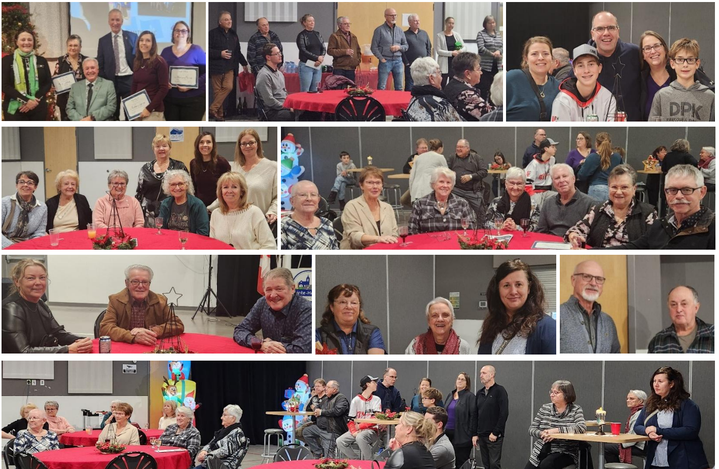
Photos de la soirée reconnaissance des bénévoles

Au nom de la Municipalité et de la population, je tiens à exprimer notre reconnaissance aux bénévoles qui se sont impliqués en 2025.