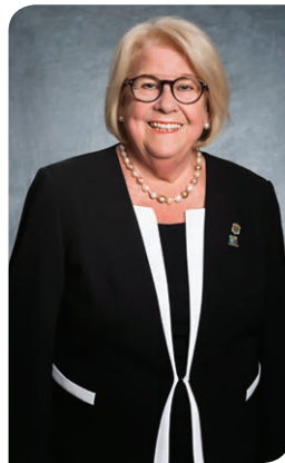
Patrick Roger photographe | MRC ©