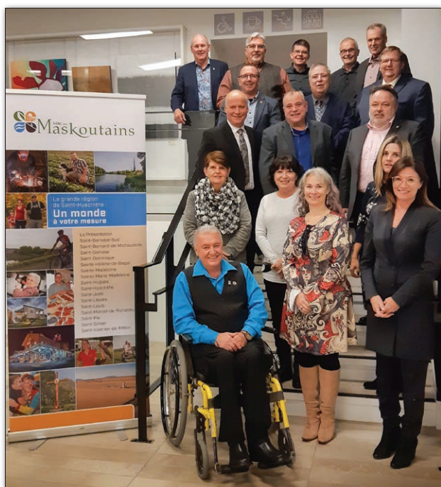
Les nouveaux membres du conseil.